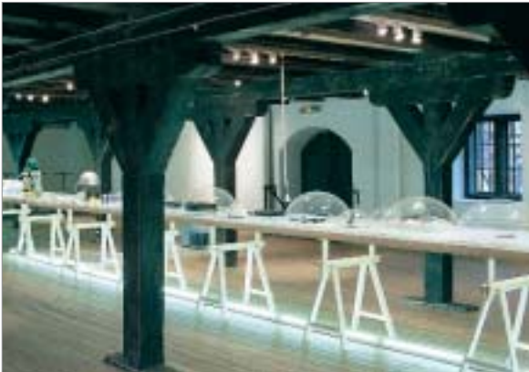
Den första utställningen av flera inom ramen för Next? visades på Form/Design Center i Malmö.