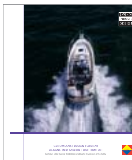
Utmärkt Svensk Form – Nimbus