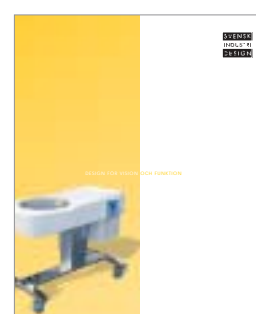
Vivar Organ Cooler