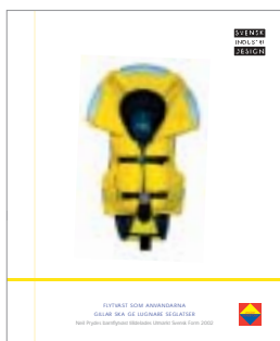
Utmärkt Svensk Form – Neil Pryde