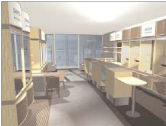
Monterinredning till Smälands Inredningar AB i Järnforsen. Utvecklad inom ramen för projektet Företag och anställda i god form .