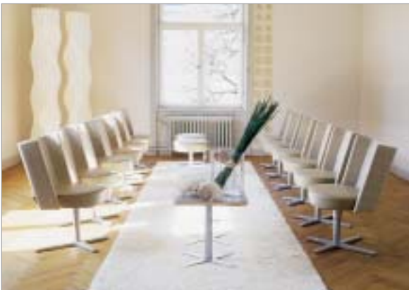
Möteskoncept. Design Kersti Sandin (Från mässan Kvinnor Kan)

centrum och ett antal företag visade vad de tror är framtidens produkt eller idé.