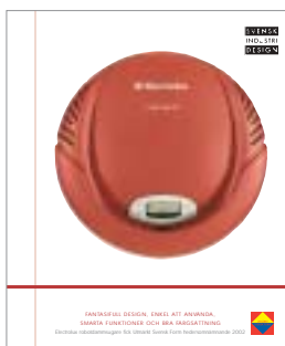
Utmärkt Svensk Form – Electrolux